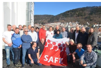
Fra kurset for SAFE i Odfjell.

Kurset holdes der det passer klubb/deltakere, og kursholderne fra SAFE kommer til dere.