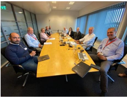
SAFE sitt engere utvalg med Norsk olje & gass

SAFE og Norsk olje og gass (NOG) kom ikke til enighet under årets lønnsforhandlinger på Oljeovernskomsten Sokkel. Etter to dagers forhandlinger stod partene langt fra hverandre. NOG hadde ingenting å tilby. Forhandlingene går nå til mekling.