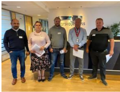
SAFE sitt engere utvalg: (fra venste):

Forhandlinger på oljeoverenskomst sokkel mellom NHO/Norsk olje og gass og YS/SAFE startet mandag 7. september i Stavanger. Det ble satt av to dager til forhandlingene. Oppgjøret ble utsatt i flere måneder på grunn av korona-situasjonen. Mye måtte gjøres annerledes i år, så de fysiske forhandlingsdelegasjonene for alle parter var kraftig redusert med kun 10 personer for SAFE, Lederne og IE. Resten av forhandlingsdelegasjonene deltok via eget møterom på Teams.