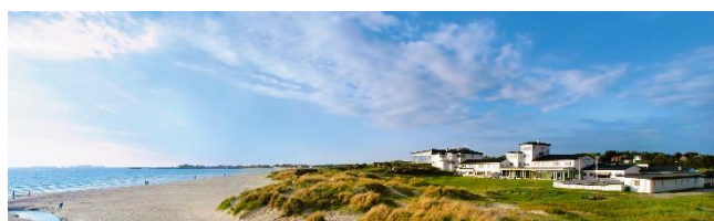
Sola strand hotel

Nytt om kjemisk arbeidsmiljø, endringer på gang i yrkesskadedeforsikringen, erstatning til oljepionerene under utarbeidelse.