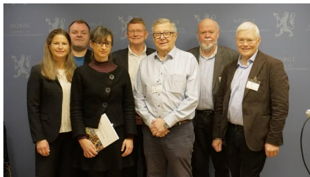
Hele kommisjonen

Kommisjonen som skal utarbeide frem en kompensasjonsordning for kjemisk skadde oljepionerer ferdigstilte og leverte sin rapport til arbeids- og inkluderingsministeren Marte Mjøs Persen (AP). SAFE er uenig i pionertiden og med målgruppen som det er tatt utgangspunkt i for denne ordningen.