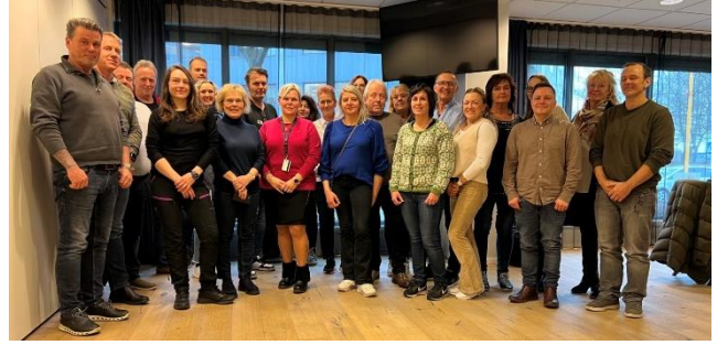
Forpleiningsklubbene samlet

– Det er viktig å drøfte problemstillinger på tvers, og ikke minst er det viktig å knytte kontakter og bli kjent med hverandre. Sånne konferanser gir både faglig og sosialt påfyll. SAFE sentralt er veldig glad for å bli forespurt som innledere og som gjester på konferansen. Det er viktig å få løftet problemstillinger og se hva forbundet kan gjøre med dette, sier hun.