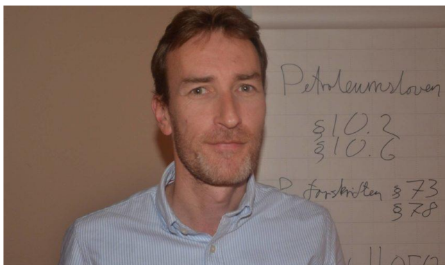
Hogne Hole

10. februar gikk alle ansatte operatører i Bilfinger ut i dagsing eller temporeduskjon. Nå har bedriften oppjustert tilbudet, og etter uravstemningen ble dette akseptert av begge klubbene.