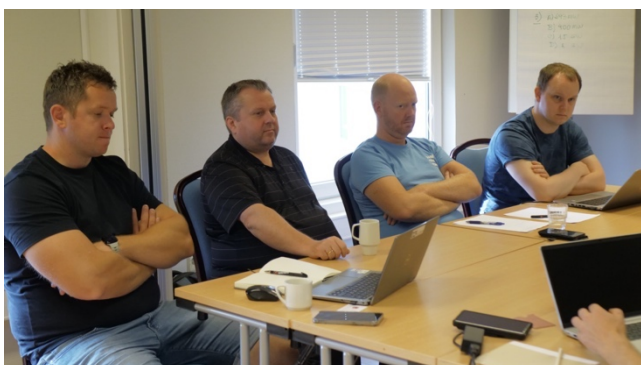
Området flerbruksfartøy har gruppemøte på Sola

Etter HMS-konferansen hadde områdene i SAFE samling.