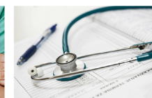
Helsesertifikat Operatør · Boring Forpleining

Helsesertifikat Helsesertifikat for Oljeservice og Offshoreservice