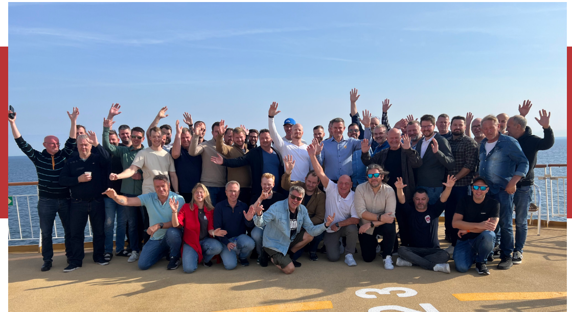
SAFE i Archer på tillitsvalgtkonferanse på Kiel-fergen