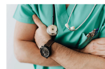
Helsesertifikat for Oljeservice og Offshoreservice

OSO administrerer de sosiale ordninger som drives av fagforbundene på sokkelen for sine medlemmer.