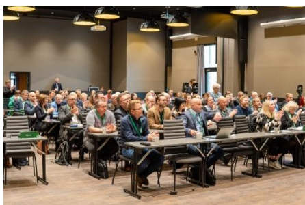
YS-konferansen 2024